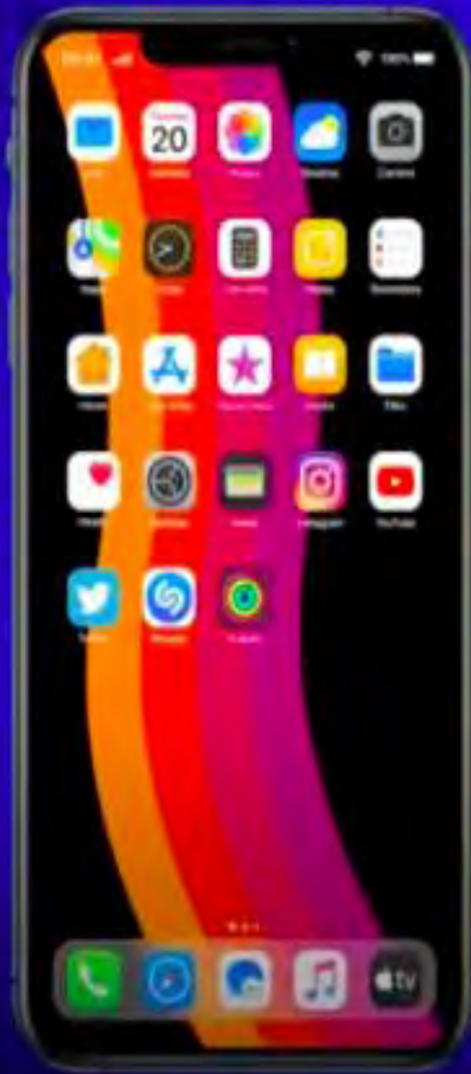
6.7 Inch Display

6.7 Inch OLED Display, 2778 x 1280, 60Hz or 120Hz